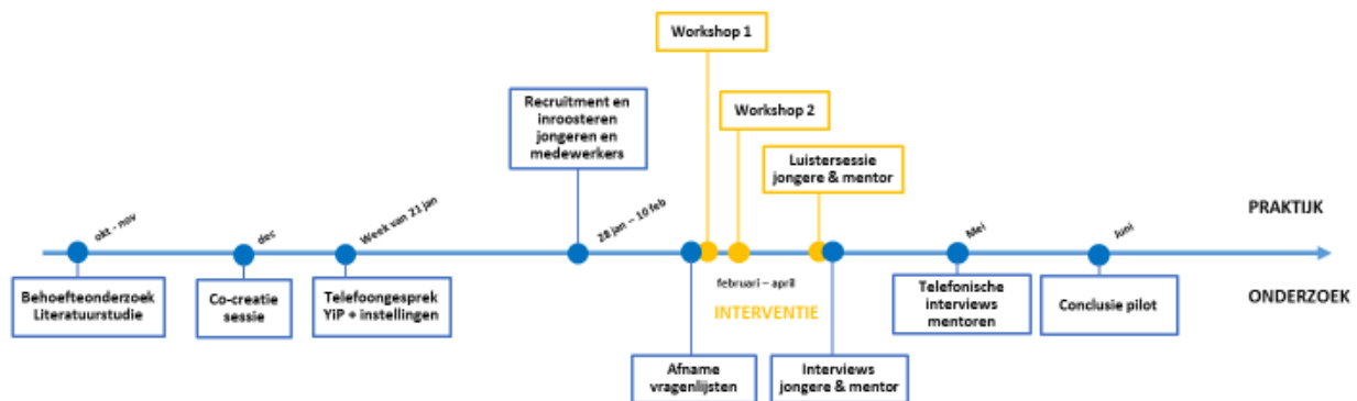
Figuur 1. Overzicht planning uitvoering methodiek en onderzoek

Tot slot zijn enkele weken na het moment van delen de deelnemende mentoren ieder individueel telefonisch benaderd door de onderzoekers en geïnterviewd. In dit interview stonden de daadwerkelijk ervaren effecten van het delen van het verhaal centraal.